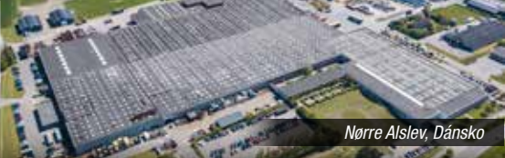
Nørre Alslev, Dánsko